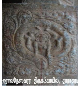
ஐராவதேஸ்வரர் திருக்கோயில், தராசூரம்

தமிழகத்தில் மிக பிரமாண்ட முறையில் முழுவதும் கருங்கற்களால் ஆன விமானங்களைக் கொண்ட கோவில்கள் நான்கில் இந்த ஐராவதீஸ்வரர் கோவிலும் ஒன்று என்பது குறிப்பிடத்தக்கது. நாட்டிய முத்திரைகளைக் காட்டி நிற்கும் சிற்பங்களும், தேர் போன்ற வடிவிலமைந்த மண்டபமும் அரிய, சிறிய, மிகச்சிறிய, சிற்பக்கலைப் படைப்புகளும் இக்கோவில் புகழுக்கு மணிமகுடங்களாகும்.