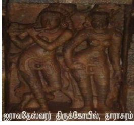
ஐராதீஸ்வரர் திருக்கோயில், தாராகரம்

அந்நிகழ்வுகளைக் கோயில்களில் பதிவிடும் வழக்கத்தை மிகுதியாக முன்னெடுத்தனர் இதன் விளைவால் அக்கதைகள் சிற்பங்களாக வடிவமைக்கப்பட்டுள்ளன. சோழ அரசர்கள் நிறுவிய கோயில்களில் நாயன்மார்களுடைய சிற்பங்கள் இருப்பினும் ஐராதீஸ்வரர் கோயிலில் மட்டுமே அறுபத்து மூன்று நாயன்மார்களுடைய சிற்பங்களும் அவர்தம் பதிகக் காட்சிகளும் 95 கற்களில் சிற்பமாக்கப்பட்டுள்ளன எனபது சிறப்பு. தில்லை வாழ் அந்தணரில் தொடங்கி அவிநாசிலிங்க நாயனார் வரைக்கும் அறுபத்து மூன்று நாயன்மாரின் சிற்பங்கள் வடிவமைக்கப்பட்டுள்ளன .