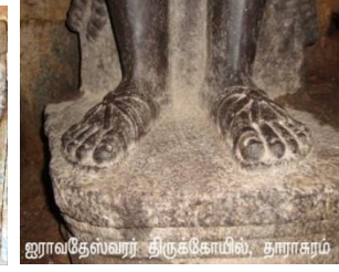
ஐராதீஸ்வரர் திருக்கோயில், தாராகரம்

இராமாயணக் காட்சிகளை நினைவூட்டும் சிற்பங்களும் அழகியலோடு படைக்கப்பட்டுள்ளன. இதுபோல் சமயச் சார்புடைய பல சிற்பங்கள் இக்கோயிலில் வடிவமைக்கப்பட்டுள்ளன. "பக்தி நெறியையும் அதனாலேற படுவனாகிய மனவுணர்ச்சியினையும் தமிழ்நாட்டுத் திருவுருவங்கள் மிக நயம்பட விலக்கிக் காட்டுவனவாம். உண்மையான பக்தியில் ஈடுபட்டுள்ள ஓர் அடியாரது உள்ளமும் உடலும் எந்நிலையுற்றிக்கு மென்பதைத் தமிழ்நாட்டுப் பக்தர்களுடைய திருவுருவங்கள் செவ்விதின் உணர்த்தும். தெய்வத் திருவுருவங்களாய் உள்ளன வழிபடுவோர் உள்ளத்திற் பக்தியின் நெகிழ்ச்சியை உண்டு பண்ணத்தக்க முறையில் அமைக்கப்பட்டுள்ளன. (ப.117, தென் இந்தியச் சிற்ப வடிவங்கள் ) என்ற கருத்தும் இங்கு குறிக்கத்தக்கது.