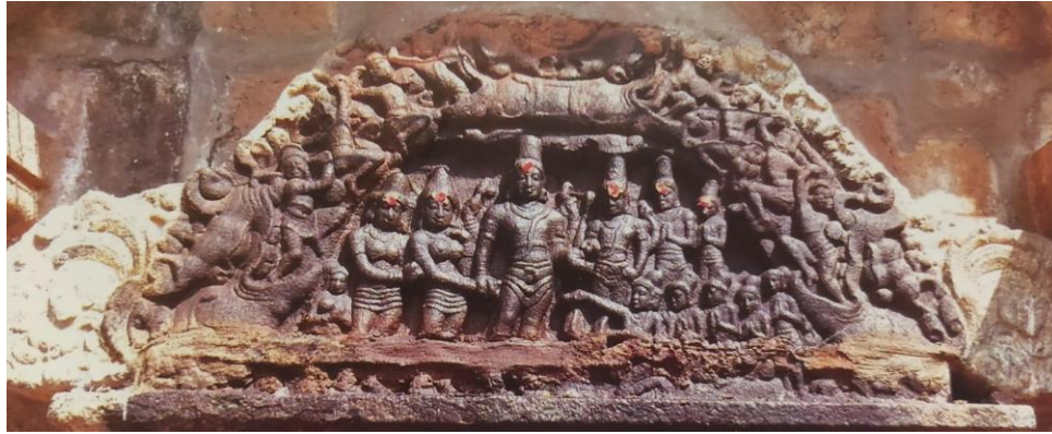
இடையில் அரைஞாள் தரித்து ஆடும் ஆடவல்லானின் அரிய திருமேனி